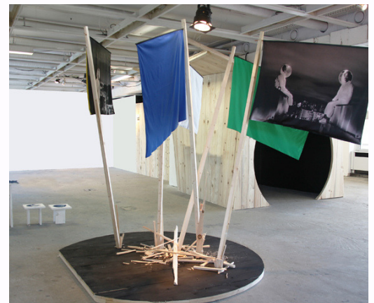
"Les éternels" @ Les soeurs Chevalme

A l'heure où le numérique bouleverse la géopolitique du monde moderne, nos civilisations surinformées sont elles plus aguerries que l'étaient les "poilus" de la grande guerre? De quelles «armes» et de quelles « libertés » disposons nous réellement?