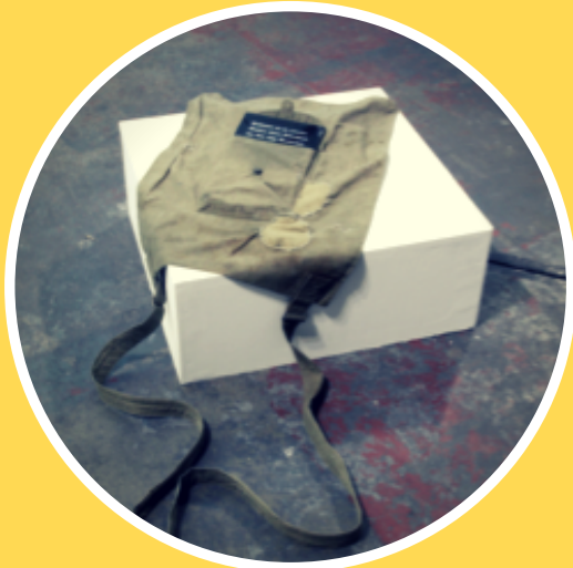
"Worse than the quick hours of open battle was this endless preparedness" (2017) © Dani Ploeger

D.R.A.W PROGRAM # SAISON 2018/2019 DIGITAL RESEARCH AND ART WAVE