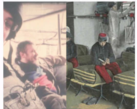
Mise en miroir d'une image extraite de l'exposition "100 ans plus tard" et d'une image extraite du film "patrol" de Dani Ploeger (2017)